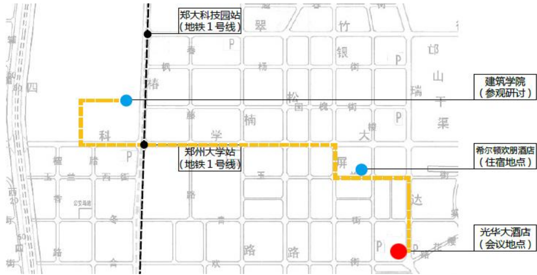
图 1. 城市地图