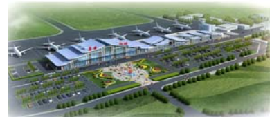
贵州茅台机场航站楼工程规划方案