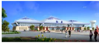
四川南充机场航站楼建筑方案