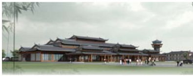
贵州茅台机场航站楼建筑方案