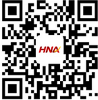
海航集团人才社区