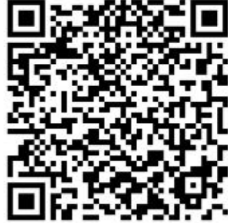
简历投递请扫上端二维码