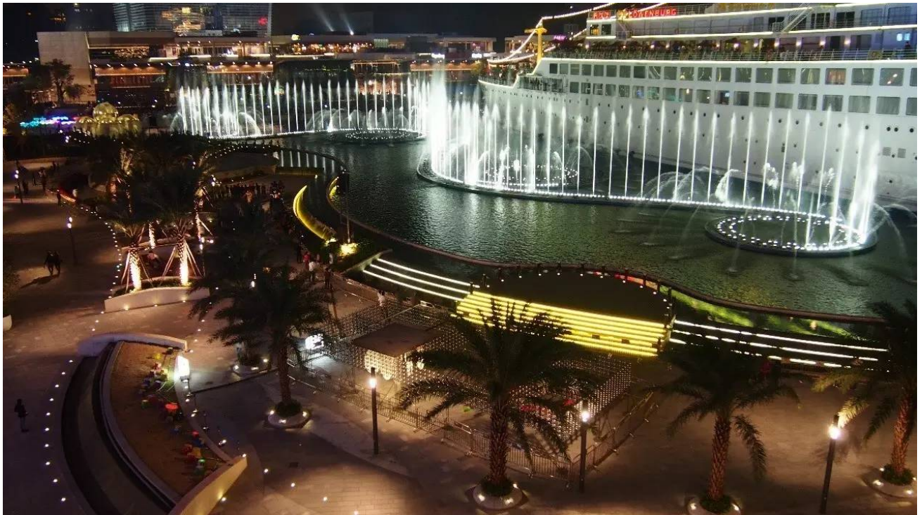
▲深圳蛇口海上世界